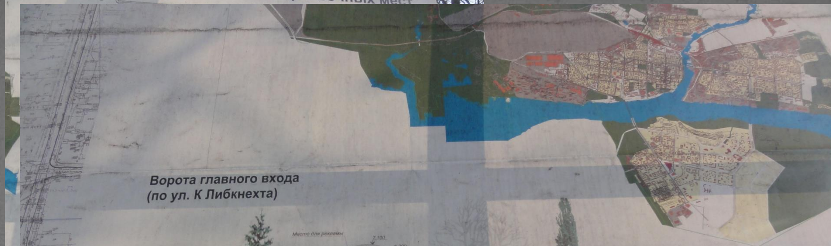
Ворота главного входа (по ул. К Либкнехта)